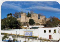
Castelo Torres Novas